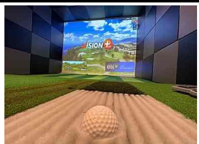
バンカーショット